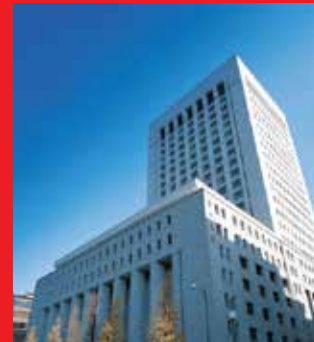
Tòa nhà trụ sở Dai-ichi Life Holdings tại Tokyo, Nhật Bản