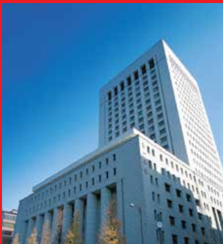
Tòa nhà trụ sở Dai-ichi Life Holdings tại Tokyo, Nhật Bản